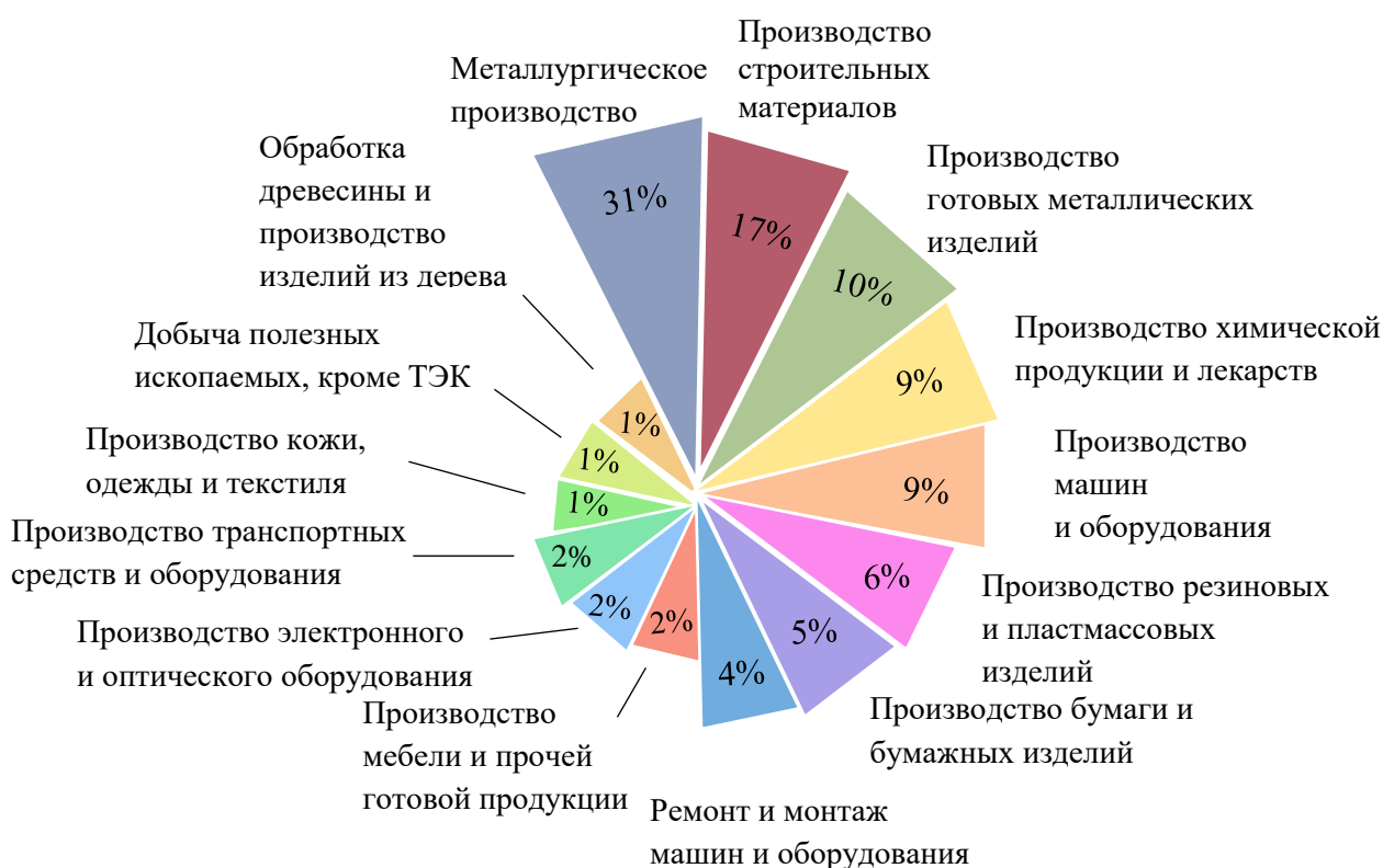
Рис. 1. Структура базовых отраслей промышленности Краснодарского края в 2021 году

Структура базовых отраслей промышленности Краснодарского края в 2021 году представлена на рисунке 1.